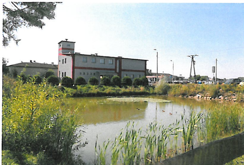
Staw przy remizie OSP

melioracyjnych osuszone. Do dziś zachował się staw obok remizy OSP. Osuszone łąki i nieużytki to doskonale miejsce życia polnych gryzoni, ptaków pospolitych, m.in. wróble,