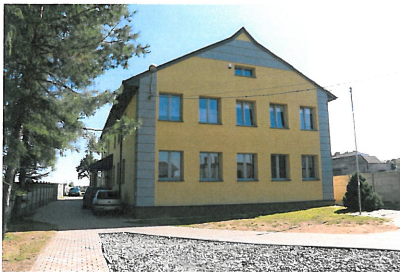
Budynek szkoły podstawowej obecnie Niepublicznej Szkoły Podstawowej w Pyrzowicach

W listopadzie i grudniu 2000 roku kolejna przebudowa ogrzewania szkoły i remont niektórych pomieszczeń. 25 lutego 2003 roku decyzją Rady Gminy Ożarowice Szkoła Podstawowa w Pyrzowicach zastała zlikwidowana. Mieszkańcy utworzyli Stowarzyszenie na rzecz Rozwoju Wsi Pyrzowice z którego inicjatywy powstała Niepubliczna Szkoła Podstawowa oraz przynależący do niej oddział przedszkolny. Szkoła obok OSP i Koła Gospodyń jest ważnym organizatorem życia kulturalnego wsi.