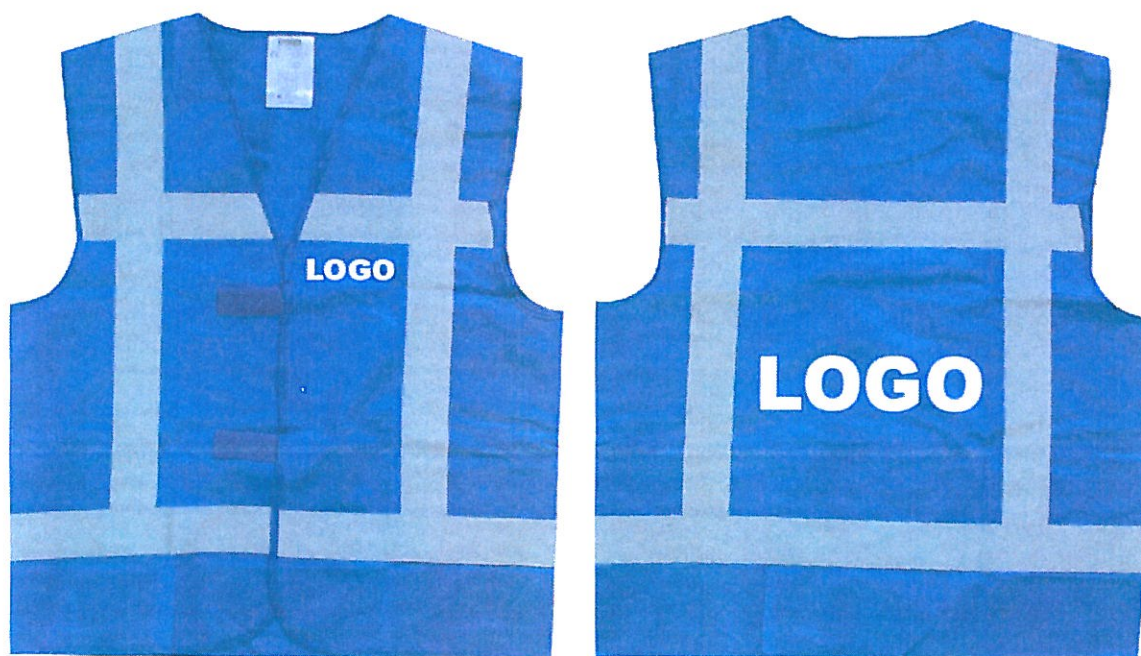
Rys. Umieszczenie międzynarodowego znaku rozpoznawczego obrony cywilnej na umundurowaniu FOC i ubiorze organów i personelu obrony