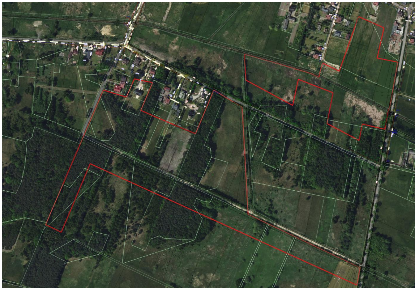
Ryc. nr 3 . Położenie terenu objętego projektem miejscowego planu w rejonie ul. Zawodą i ul.Dworcową

Poniżej granice terenu objętego projektem miejscowego planem zagospodarowania przestrzennego przedstawione na zdjęciu satelitarnym.