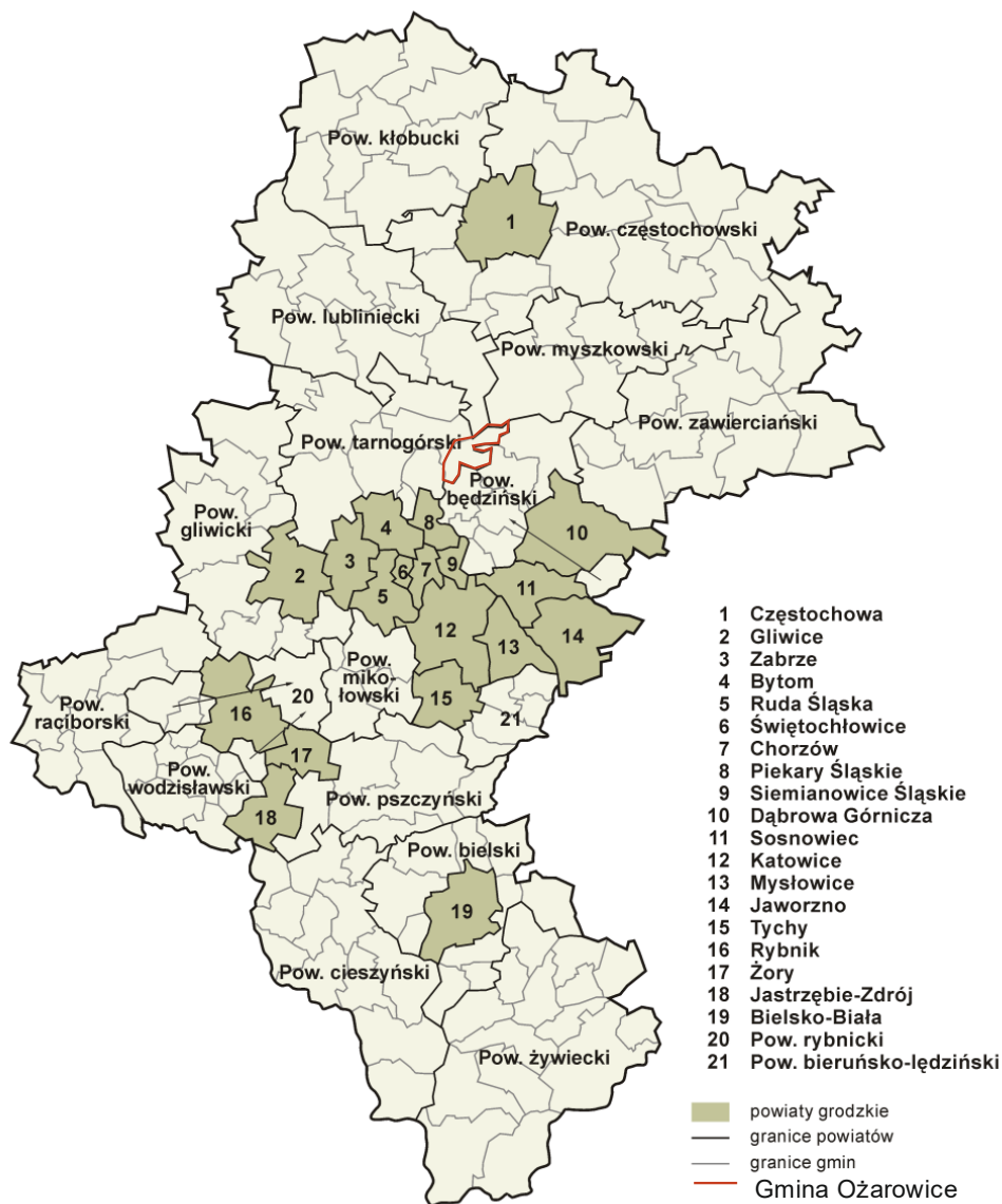
Ryc. nr 1 Położenie gminy Ożarówce na tle woj. śląskiego

Bliskie sąsiedztwo dużych miast aglomeracji śląskiej (Katowice, Tarnowskie Góry, Bytom) oraz międzynarodowego Portu Lotniczego Katowice w Pyrzowicach nadaje gminie znaczenie komunikacyjne, gospodarcze i logistyczne.