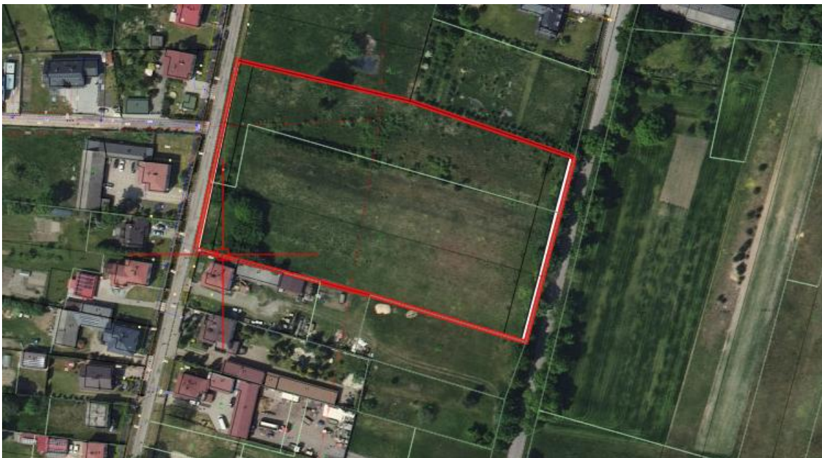
Ryc. nr 2. Położenie obszaru opracowania w rejonie ulicy Dworcowej a Wojska Polskiego.

Teren objęty opracowaniem znajduje się w granicach obowiązującego miejscowego planu zagospodarowania przestrzennego przyjętego Uchwałą Nr XIX/192/2004 Rady Gminy Ożarówice z dnia 16 września 2004 r. Zgodnie z jego zapisami przedmiotowy obszar przeznaczony jest pod: