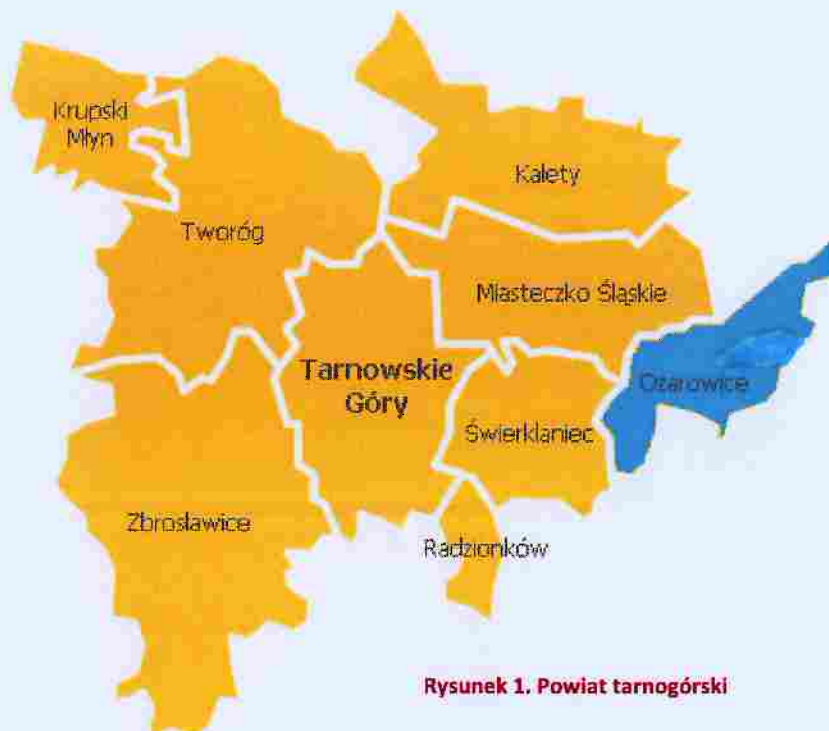
Rysunek 1. Powiat tarnogórski

Powierzchnia Gminy Ożarowice wynosi 46 km 2 , co stawia ją na siódmej pozycji wśród gmin powiatu tarnogórskiego.