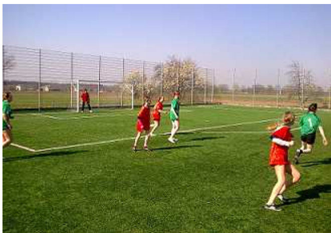
Rozgrywki podczas oficjalnego otwarcia boiska sportowego przy Gimnazjum.