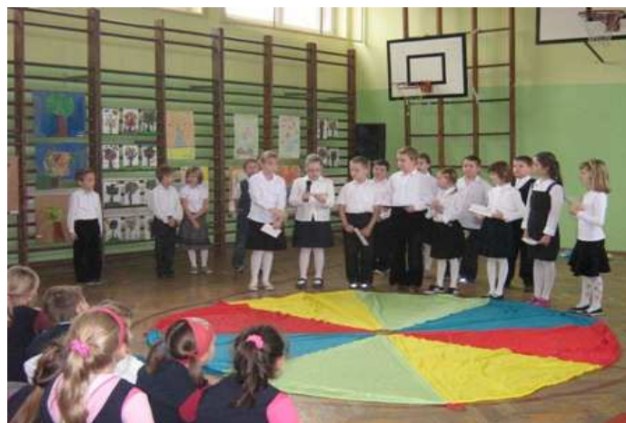
Pokaz uczniów - projekt Pierwsze uczniowskie doświadczenia.

KONKURSY Uczniowie mają możliwość rozwijania swoich zainteresowań poprzez udział w wielu konkursach szkolnych i międzyszkolnych, m.in.: Wojewódzkim Konkursie Interdyscyplinarnym dla Uczniów Szkół Podstawowych, Powiatowym Konkursie Ortograficznym o Złote Pióro Starosty Tarnogórskiego i Burmistrza Miasta oraz konkursie matematycznym „Koziegłowy — mądre głowy”. Ponadto, mogą także uczestniczyć w zawodach sportowych, np. Powiatowych Zawodach Mini Siatkówki Dziewcząt czy Wojewódzkich Zawodach w Tenisie Stołowym Dziewcząt.