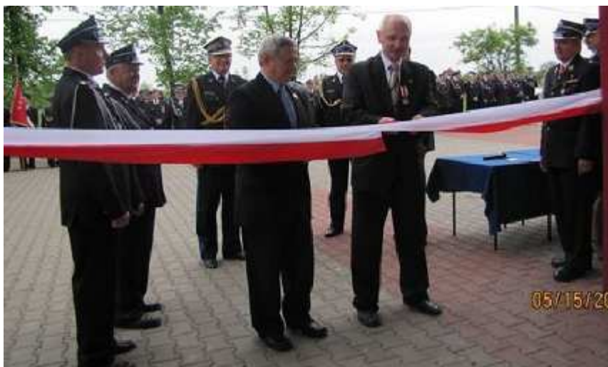
Uroczyste otwarcie wyremontowanej remizy OSP w Ossach.