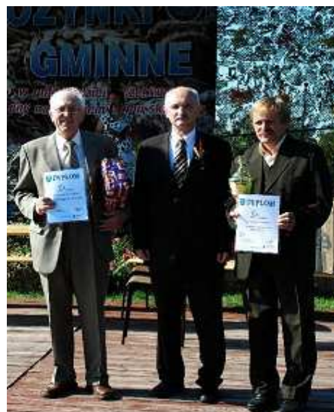
Wręczenie dyplomów i pucharu.