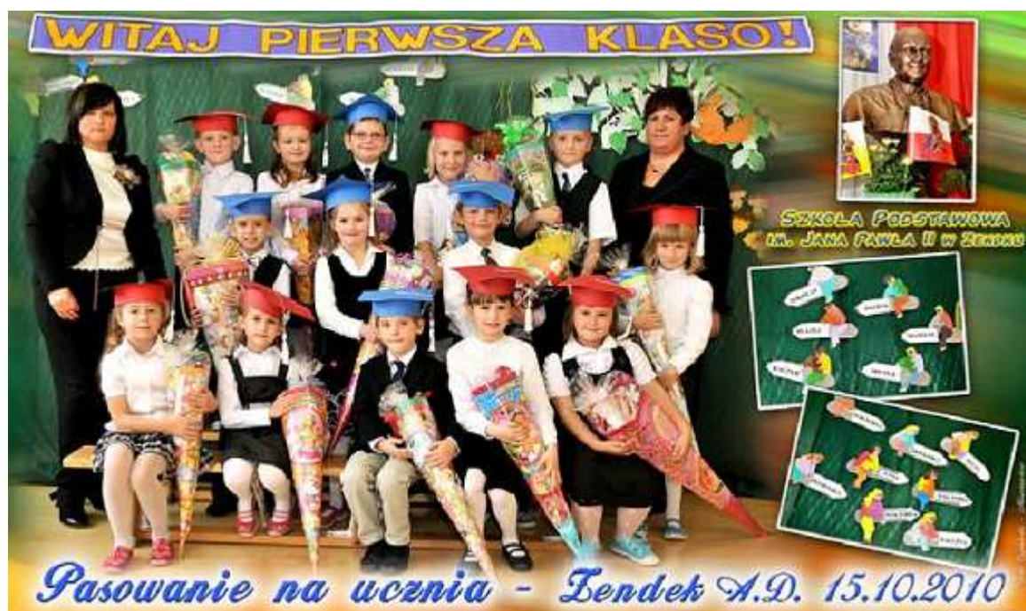
Uroczyste ślubowanie uczniów klasy I Szkoły Podstawowej w Zendku.

KONKURSY Uczniowie mają możliwość rozwijania swoich zainteresowań poprzez udział w wielu konkursach szkolnych i międzyszkolnych, m.in.: Gminnym Konkursie Matematycznym, Międzyszkolnym Konkursie Recytatorskim, Gminnym Konkursie Plastycznym, Okręgowym Konkursie Recytatorskim, Gminnym Konkursie Literackim. Ponadto, mogą także uczestniczyć w zawodach sportowych, np. Międzygminnym Turnieju Tenisa Stołowego Dziewcząt i Chłopców, Sztafetowych Biegach Przełajowych, Turnieju Piłki Nożnej.