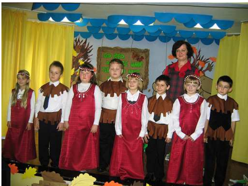
Pasowanie na uczenia w NSP w Pyrzowicach.

W czasie spotkań kółka starano się wprowadzać różnorodne techniki plastyczne i etudy sceniczne. Interesującą formą zmagania plastycznych stał się konkurs zorganizowany przez MDK w Będzinie. Zadaniem uczestników było namalowanie martwej natury. W listopadzie 2007 r. uczestnicy przygotowywali spektakl teatralny, którego premiera odbyła się podczas spotkania andrzejkowego. Sztuka O Zuzannie, co nie chciała być panną wprowadziła uczniów w fascynujący i tajemniczy czas andrzejkowych wróżb. W drugim semestrze roku szkolnego 2008/2009 uwaga uczestników skupiała się na rozwijaniu zdolności plastycznych i teatralnych. Przygotowano spektakl teatralny pt. Bajka o królu, który zgubił koronę . Spektakl został wystawiony z okazji Dnia Aktora-Amatora w OSP w Pyrzowicach. Dla uczestników, którzy najaktywniej działali w kole i mogli poszczycić się wieloma sukcesami, ufundowano wyjazd do teatru. Podczas Jubileuszu Szkoły młodzi plastycy i aktorzy zaprezentowali spektakl inspirowany obrazem Picassa Guernica . Zorganizowali także akcję plastyczną Dzieła mistrzów w nowej wersji .