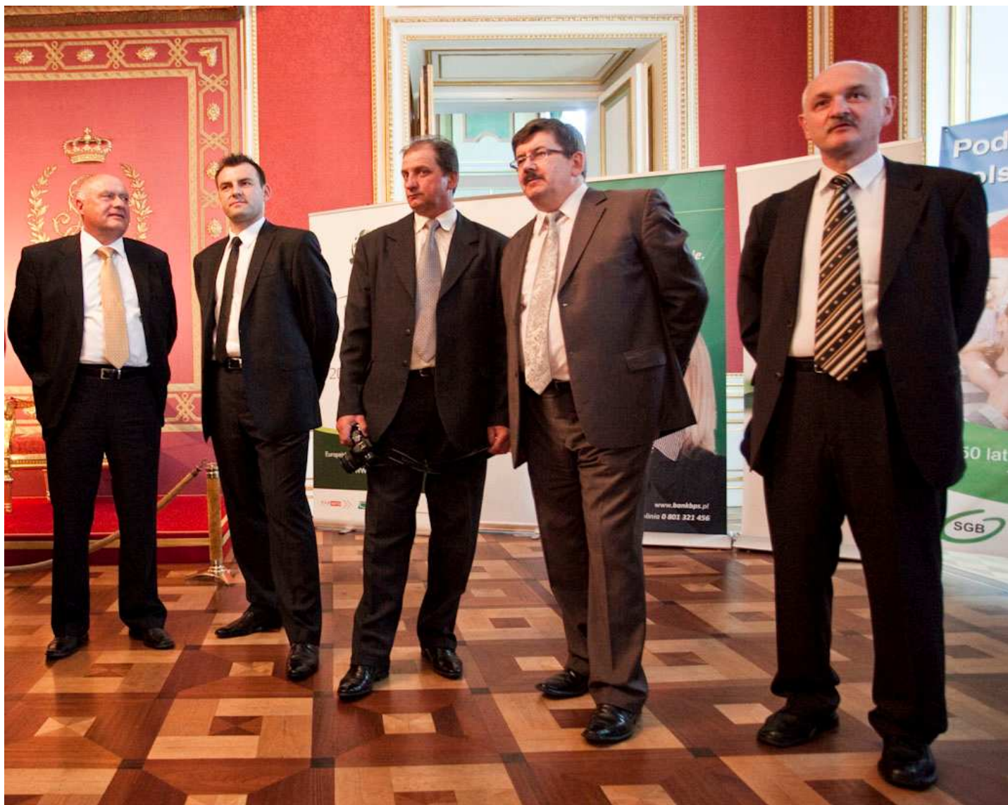
Wójtowie wyróżnionych gmin przed rozpoczęciem gali w Sali Tronowej.