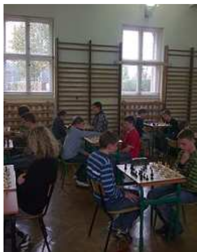
Turniej Szachowy - Mistrzostwa Gimnazjów o Puchar Burmistrzów i Wójtów Powiatu Tarnogórskiego.