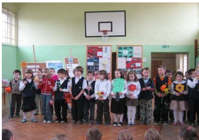
Podsumowanie projektu Uczymy się nie dla szkoły, lecz dla życia.