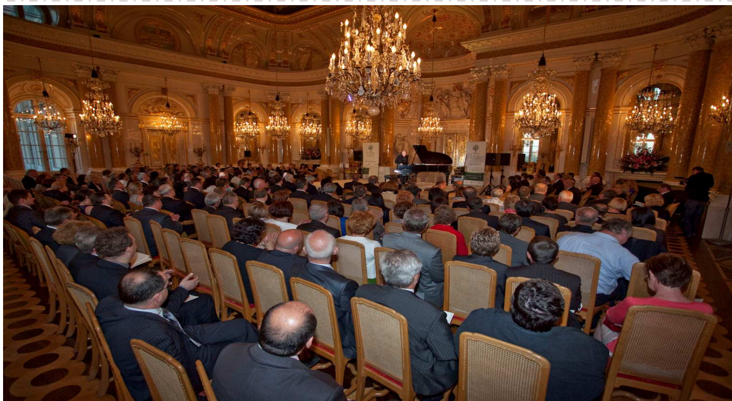
Podczas Gali w Sali Balowej.