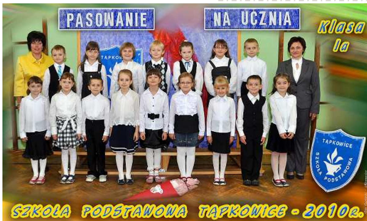
Uczniowie klasy I a Szkoły Podstawowej w Tapkowicach.