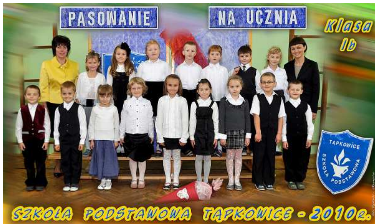
Uczniowie klasy I b Szkoły Podstawowej w Tapkowicach [fotografia dzięki uprzejmości Pana Artura Cyplińskiego].