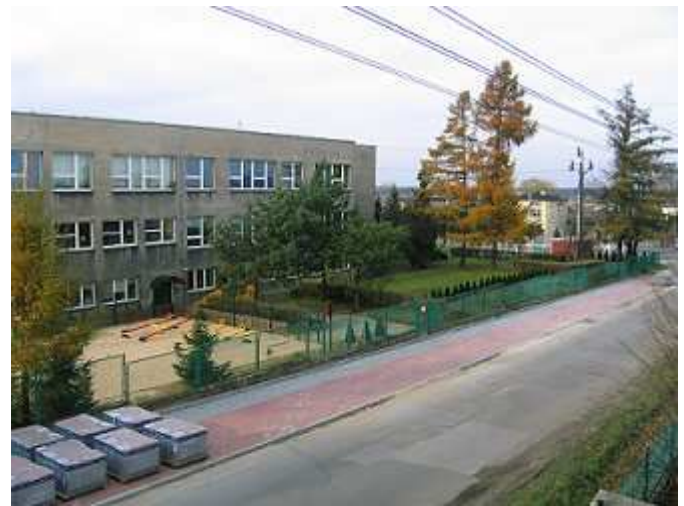
A tak wygląda chodnik w trakcie budowy.