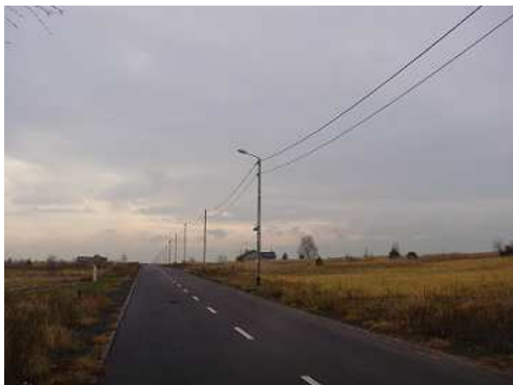
Sieć energetyczna i oświetleniowa przy ul. Generała Maczka. Czy zostanie rozebrana?

W dniu 4. listopada na stronie internetowej Stowarzyszenia „SOLIDARNI RAZEM” ukazała się Decyzja Powiatowego Inspektora Nadzoru Budowlanego ws. rozbiórki sieci elektrycznej (nr 76/2010) przy ul. Gen. Maczka, nakazująca Inwestorowi - Wójtowi Gminy Ożarówice