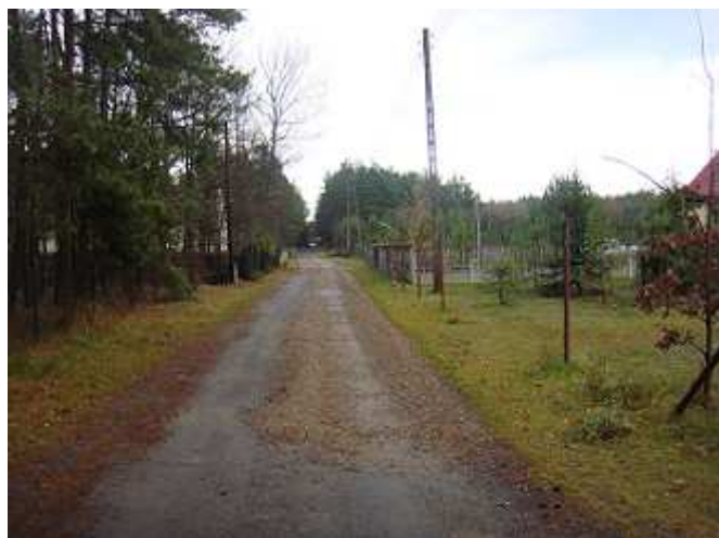
Droga od ul. Straków do działek rekreacyjnych - utwardzona nawierzchnia.