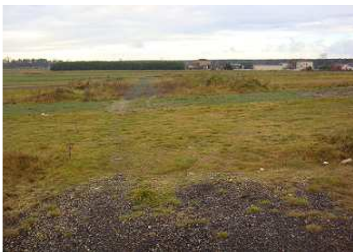
Droga od kościoła do cmentarza - brak możliwości kontynuacji budowy.