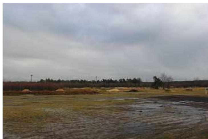
Budowa boiska dla LKS „Tęcza”.

Na następnej stronie przedstawiamy wizualizację Szkoły Podstawowej po rozbudowie i wybudowaniu sali gimnastycznej. Widok od strony ul. Południowej. W roku 2006 rozpoczęto prace projektowe. W roku 2008 uzyskano pozwolenie na budowę. W czerwcu 2008 złożono wniosek o dofinansowanie w ramach środków UE. Kwota dotacji miała wynieść 7,5 mln zł. W marcu 2009 rozstrzygnięto konkurs, w którym zajęliśmy 12. miejsce na 142 projekty w województwie śląskim. Pieniądze przyznano dla pierwszych 11. Sala gimnastyczna jest na 1. miejscu listy rezerwowej. W 2010 r. z zaoszczędzonych środków Marszałek Województwa przyznał pieniądze na 3 projekty z listy rezerwowej, pomijając Zendek. Gmina buduje więc za własne pieniądze. Firma budowlana zostanie wybrana 18. listopada. Całkowity koszt to 9 mln zł. Będą tam również dwa boiska zewnętrzne z nawierzchnią syntetyczną, plac zabaw, parking i skwer.