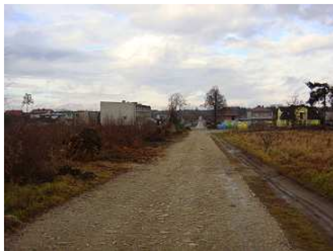
Trwa budowa chodnika, wodociągu, jezdni asfaltowej i kanalizacji deszczowej przy ul. Południowej.