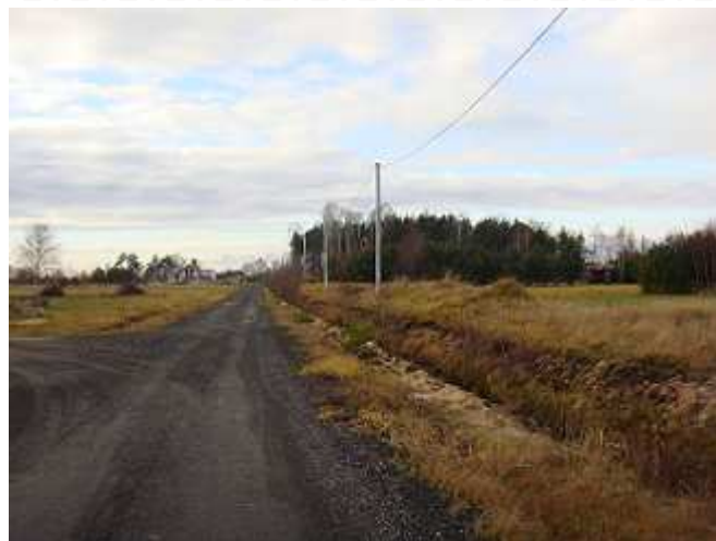
Trwa budowa drogi, rowów, mostków, wodociągów i oświetlenia przy ul. Spokojnej.