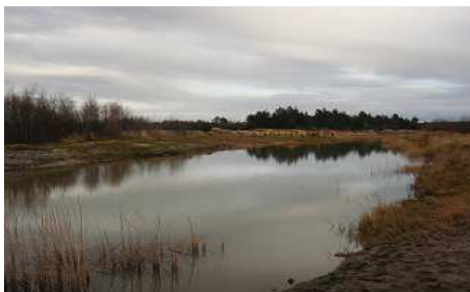
Teren rekreacyjny - oczko wodne.