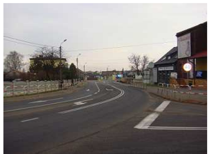
Przebudowa drogi krajowej nr 78 (ul. Zwycięstwa).