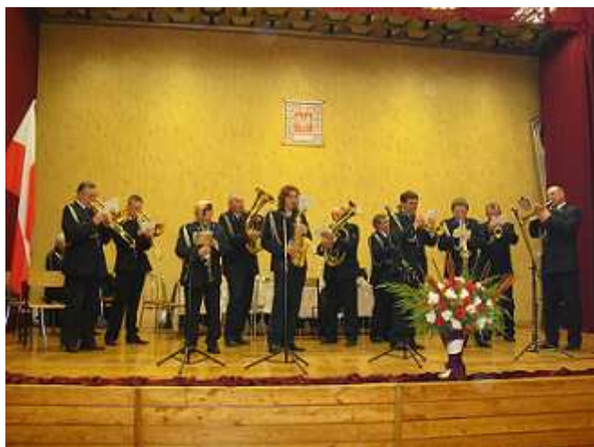
Strażacka Orkiestra Dęta w mieszanym składzie.