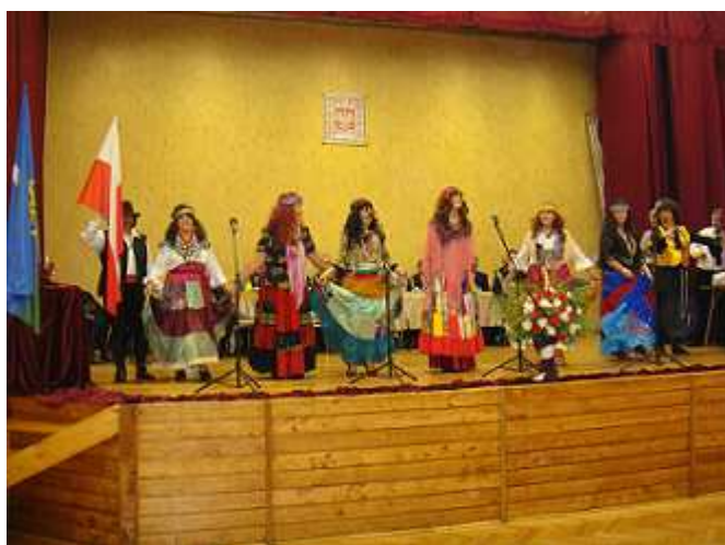
Zespół Teatralno-Kabaretowy „Bez Chłopa” zaprezentował program artystyczny Na Cygańską nutę .

11 listopada obchodziliśmy 92. rocznicę odzyskania przez Polskę niepodległości. Tegoroczne uroczystości odbyły się w Ożarówicach. Wzięli w nich udział mieszkańcy, przedstawiciele organizacji społecznych działających na terenie gminy. Organizatorami byli: Związek Weteranów Wojska Polskiego oraz BiOK. Uroczystą Mszę św. odprawił ks. Antoni Cichor. Część artystyczna odbyła się w sali widowiskowej OSP w Ożarówicach.