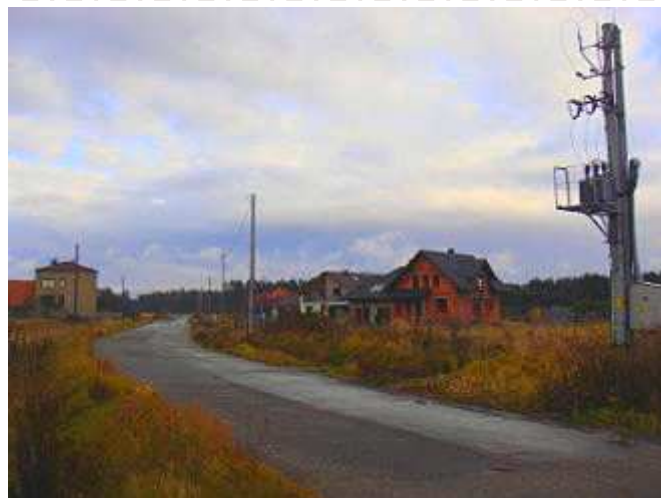
Trwa budowa sieci oświetlenia ulicznego przy ul. Straków.