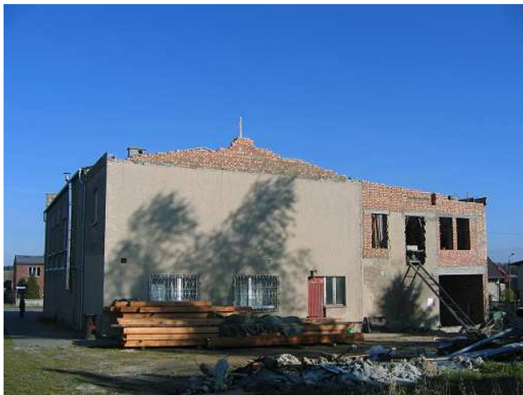
Remiza OSP w re- moncie.