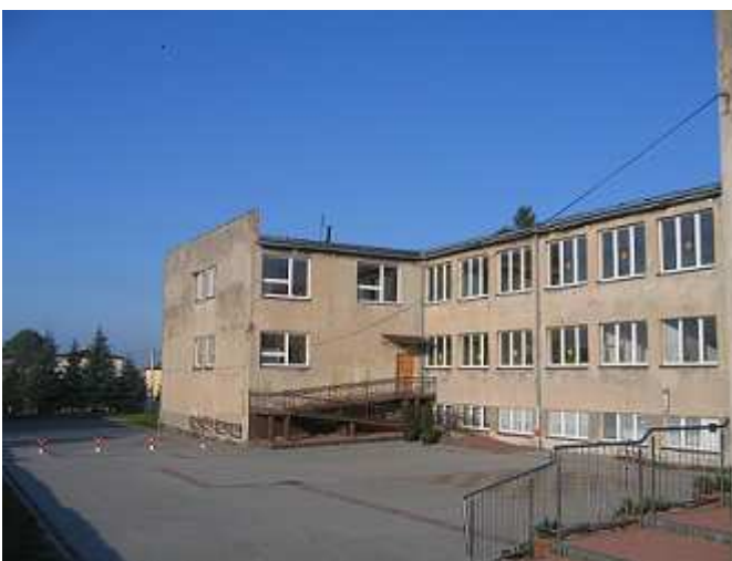
Wybieg wokół szkoły po wyłożeniu kostką.