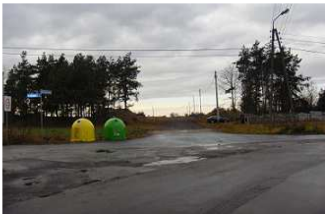
Ul. Ks. Antoniego Śliwy - wybudowano drogę, wodociąg i oświetlenie.