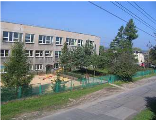
Pobocze przed szkołą i przedszkolem (przed remontem).

Sołectwo jako jedyne nie posiada Miejscowego Planu Zagospodarowania Przestrzennego. Od 2004 r. niewielka grupa mieszkańców skutecznie uniemożliwia jego opracowanie. Brak planu nie pozwala na rozwój wsi.