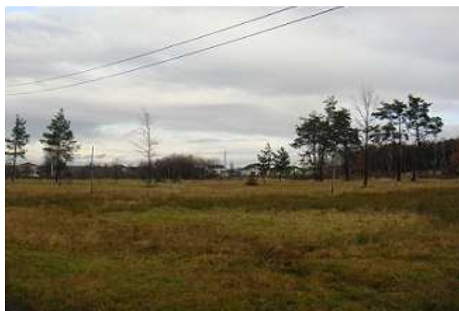
Skwer u styku ulic Jesionek, Spacerowej i Spokojnej.