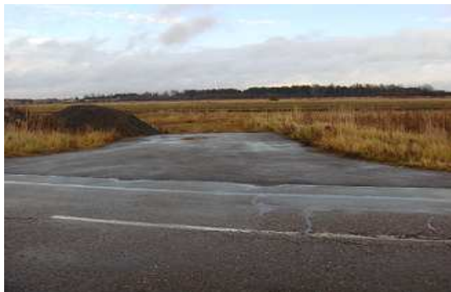
Początek nowej drogi od strony zachodniej.