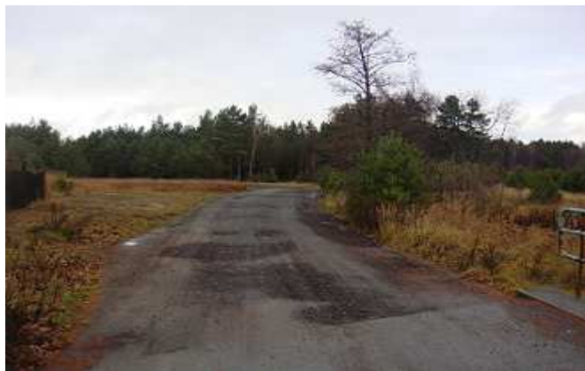
Straków - droga do Cynkowa.