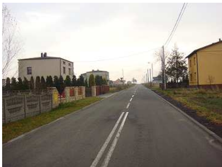
Ul. Generała Maczka wybudowana w ramach NPPDL.